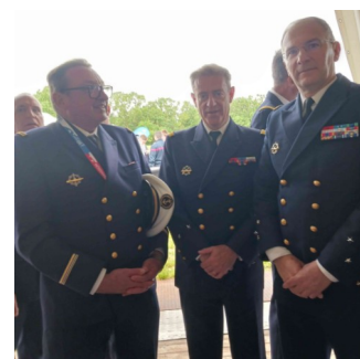
Le président, l'adjoint ALFOST, ALFOST