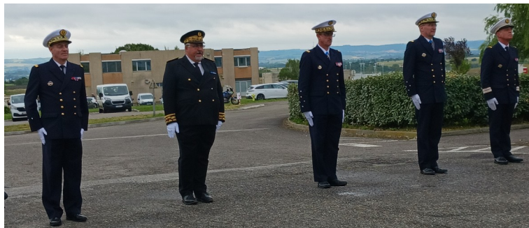
Adjoint ALFOST, Préfet de l'AUDE, Chef d'État Major de la marine, ALFOST, CDT du CTM