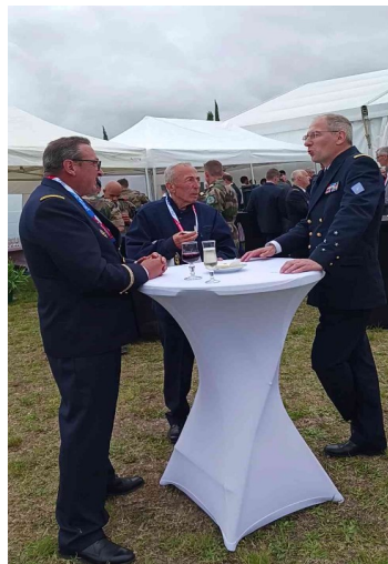
Echange avec ALFOST sur des souvenirs communs