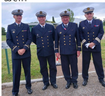
Retrouvailles avec des collègues de Brest