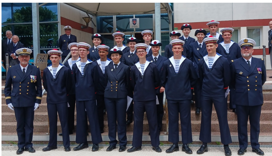
La PMM AGEN 2024 avec le CC Agenet et l'EV1 Hanquez

Notre amicale a été conviée à la remise des diplômes de la PMM AGEN. Ce fut un plaisir partagé de pouvoir honorer ces petits jeunes de notre présence lors de cette cérémonie au sein du 48 Régiment de Transmission au quartier Toussain à AGEN. Le régiment assure un soutien sans défection de la PMM, en effet dans nos terres nous n'avons pas d'unité marine pour animer ces premiers pas dans la marine des nouvelles recrues. Les familles qui confient leurs enfants, car la plus part ne sont pas majeur, accordent aux instructeurs une grande confiance. La présence des parents, des associations patriotiques avec des porte drapeaux, la sécurité civile, représentant militaires et civils ont donné un caractère solennel à cette cérémonie. Après le traditionnel défilé, les responsables de la PMM avec leurs instructeurs, la sécurité civile ont remis les diplômes avec le permis côtier, le certificat de premier secours. Un échange à l'issue de la cérémonie autour d'un rafraîchissement a permis de rassurer et conforter les jeunes sur leur engagement autour des valeurs militaire et de la marine plus particulièrement.