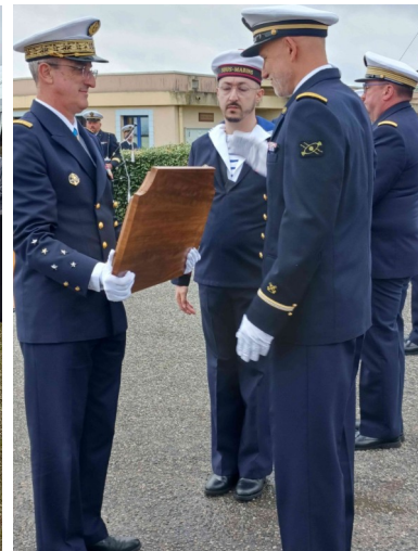
Remise de plaques commémoratives aux noms de marins illustres à différents responsables de services par le CEM.

Après cette journée riche en rencontres et émotions, malgré une météo mitigée, nous avons échangé nos adresses afin de continuer ce lien qui nous est cher.