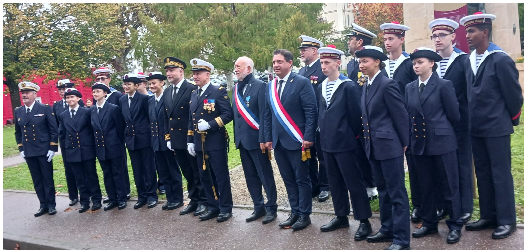
Remise du fanion et photo de la PMM avec le préfet, les autorités militaires, les élus et les marins d'encadrement

A l'issue, un moment de convivialité a été offert par la municipalité, nous avons pu nous entretenir avec les jeunes recrues et leur famille sur l'avenir dans la marine. Notre retour d'expérience a pu les éclairer sur toutes les possibilités qui s'offrent à eux pour une carrière militaire en fonction de leurs ambitions.