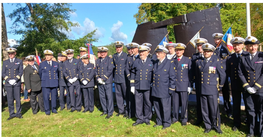
Les représentants des différentes associations, amicales et PMM