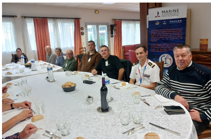
Le moment de convivialité au carré du Commandant.