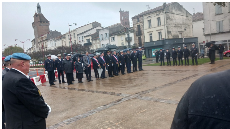
Dépôt de gerbe en mémoire de l'anniversaire de la mort du Général de GAULLE avec le préfet, les élus et les corps constitués